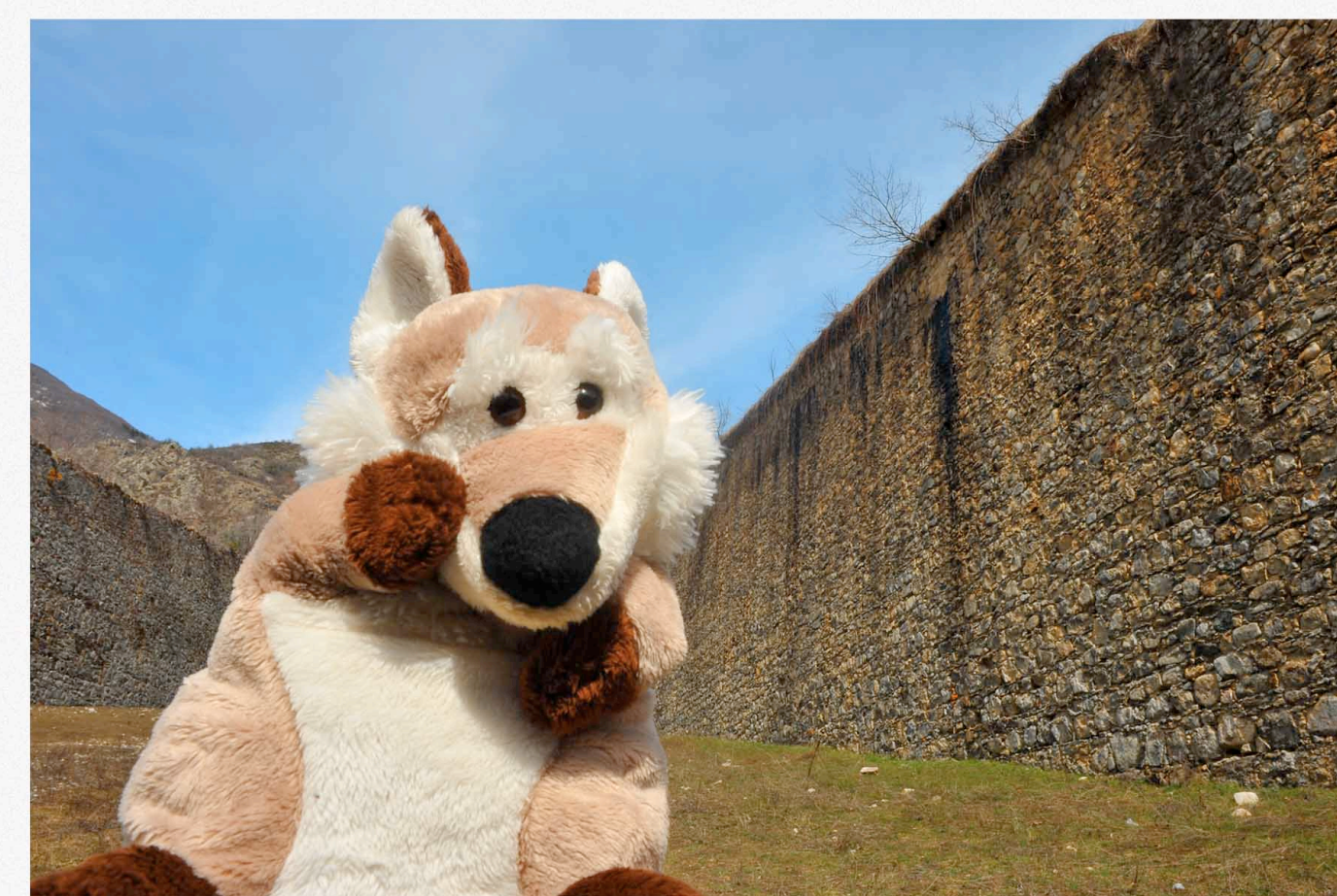
B FORTE ALBERTINO DI VINADIO