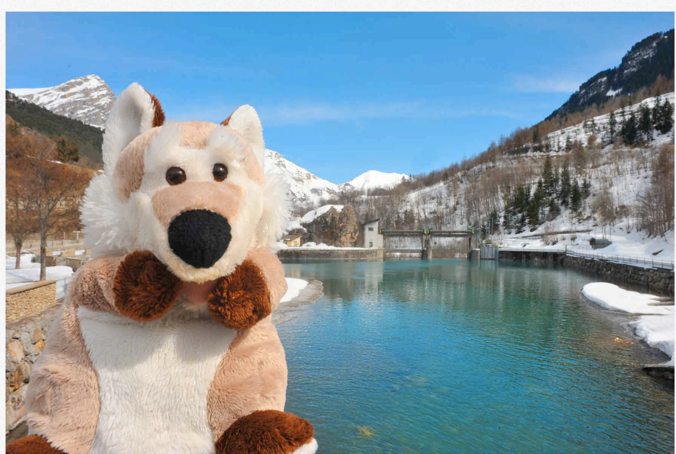
A DIGA DI PIETRAPORZIO